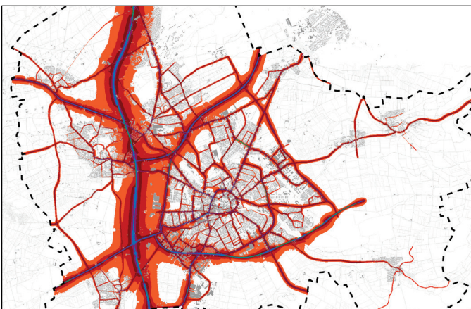
Paderborn: Lärmkarte L DEN Straßenverkehr

G emäß EG-Umgebungsärmrichtlinie wurde für die Stadt Paderborn ein Lärmaktionsplan erarbeitet. Über die gesetzliche Pflicht der Lärmkartierung von Hauptverkehrsstraßen mit mehr als 6 Mio. Kfz/Jahr und von Haupteisenbahnstrecken mit mehr als 60.000 Zugfahrten/Jahr hinaus hat sich die Stadt Paderborn für eine netzbezogene Herangehensweise entschieden. Daher wurden zusätzlich ein verdichtetes Straßennetz und ein erweitertes Schienenverkehrsnetz untersucht.