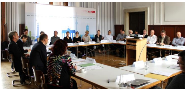
Berlin: Abstimmung der Strategien und Maßnahmen mit Politik und Interessenverbänden im Berliner Lärmforum