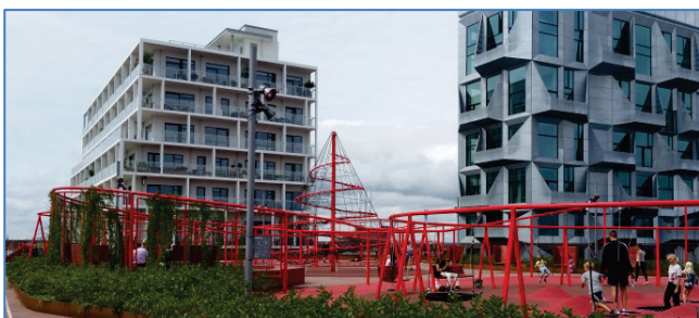
Quartiersgarage mit Spiellandschaft auf der Dachebene